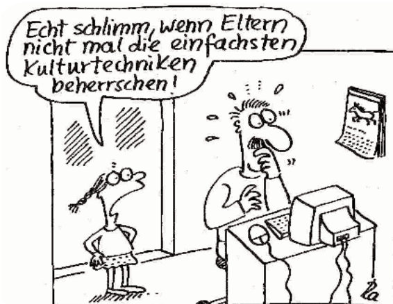
Cartoon: Renate Alf